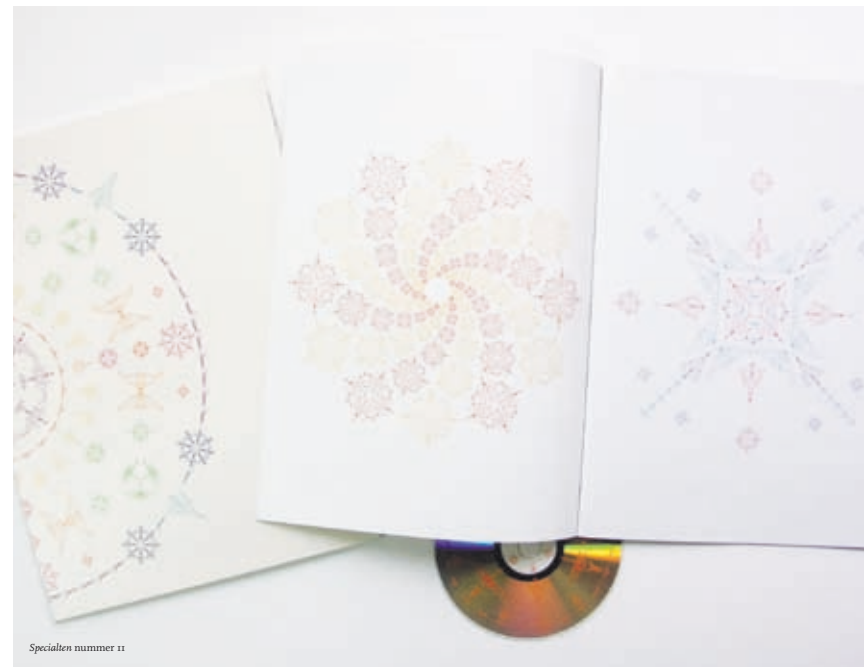
Specialen nummer 11