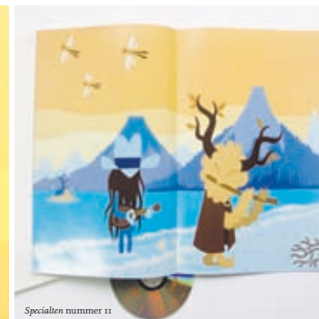
Specialen nummer 11