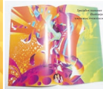
Specialen nummer 9, illustrasjon: UNIVRAAL EVERYTHING